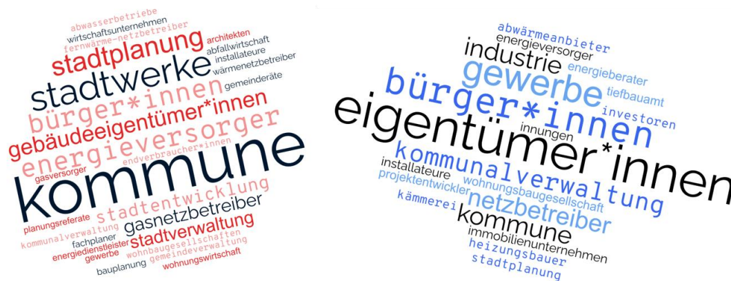
Abbildung 2: Von den Interview-Partnern genannte Akteure (links) und Zielgruppen (rechts) der kommunalen Wärmeplanung.

Handlungsleitfäden unterstützen können. Darüber hinaus spielt die Bundesebene eine entscheidende Rolle. Hier wird über die Einführung und die rechtliche Ausgestaltung einer verpflichtenden Wärmeplanung für Kommunen entschieden. Der Bund stellt außerdem relevante Förderprogramme für Kommunen und Hauseigentümer zur Verfügung.